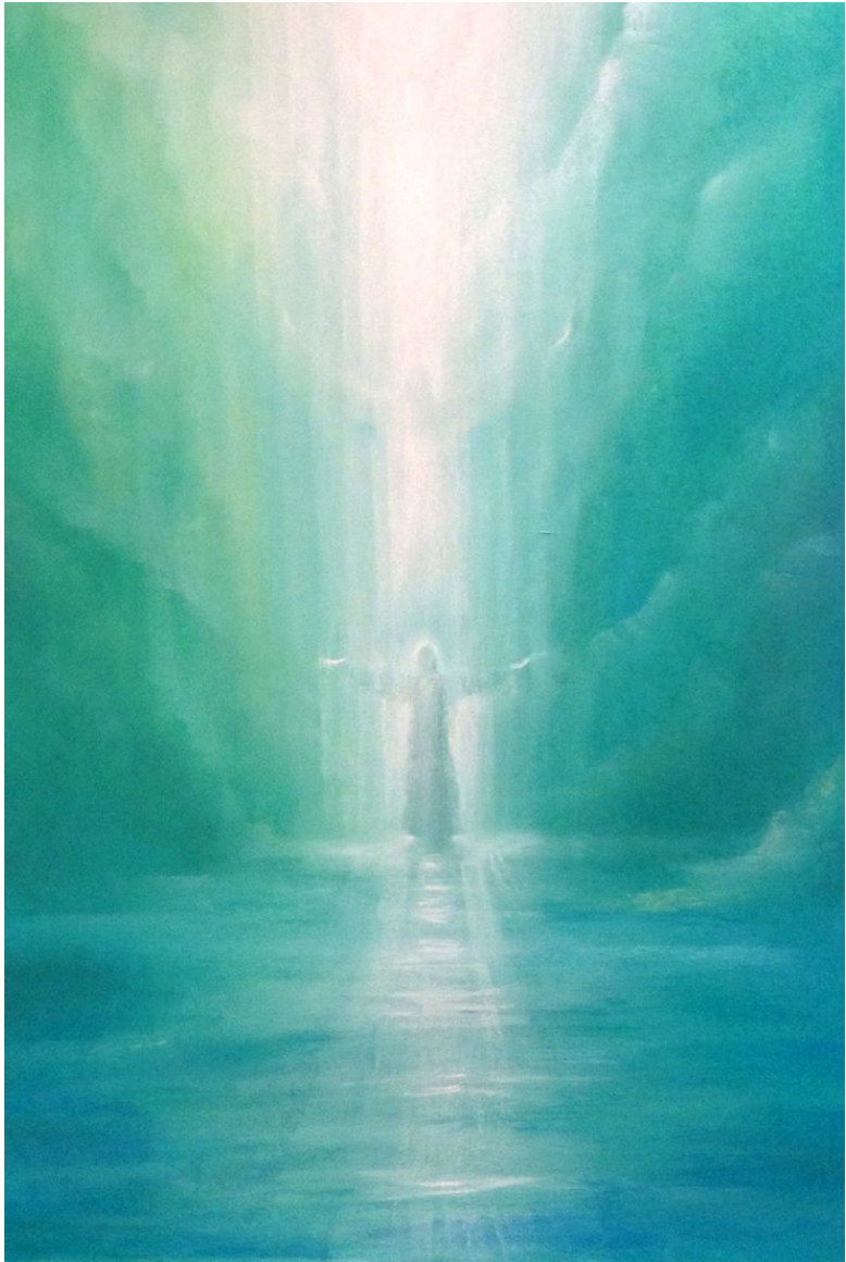
Afbeelding: Ninetta Sombart